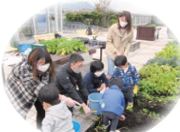
園児さんとじゃが芋掘り