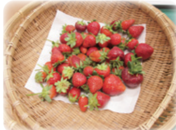
真っ赤になったイチゴ