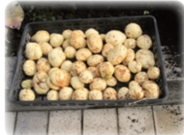
たくさん採れたじゃが芋