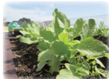
大きく育った大根