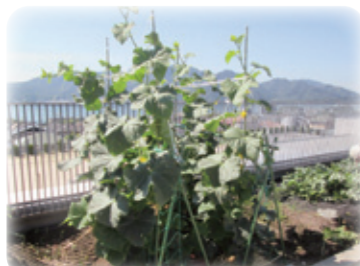
たわわに生ったきゅうり