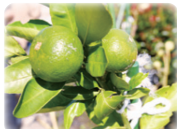
甘酸っぱいみかん

令和元年から始まった園芸療法のその後について紹介いたします。当初は認知症の方を対象に活動を通して楽しみや生きがいに繋げ、どの様な変化がみられるかという研究で始めましたが、現在は研究的視点とは別に、沢山のご入居者が利用し楽しんでいただける「屋上菜園」となりました。