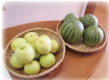
小さいながらも甘い プリンスメロン(左)と小玉スイカ(右)