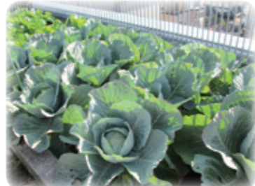
青々としたキャベツ